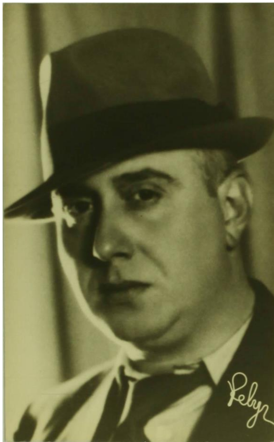
12. Retrato de Cassiano Branco na década de 1930