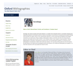
OXFORD BIBLIOGRAPHIES TRIAL