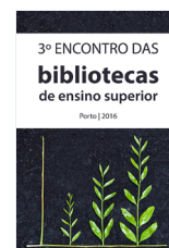
3º ENCONTRO DAS BIBLIOTECAS DE ENSINO SUPERIOR