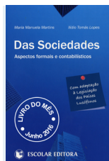
LIVRO DO MÊS DAS SOCIEDADES