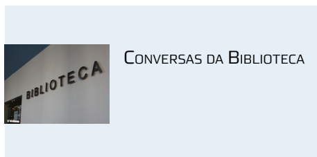
CONVERSAS DA BIBLIOTECA