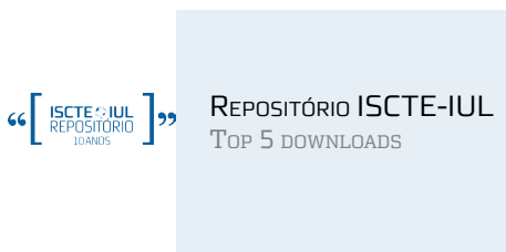
REPOSITÓRIO ISCTE-IUL TOP 5 DOWNLOADS