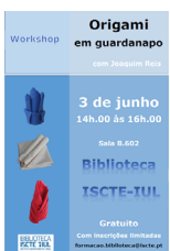
ORIGAMI EM GUARDANAPO WORKSHOP