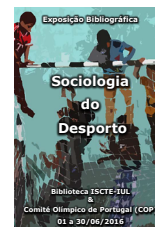
EXPOSIÇÃO BIBLIOGRÁFICA SOCIOLOGIA DO DESPORTO