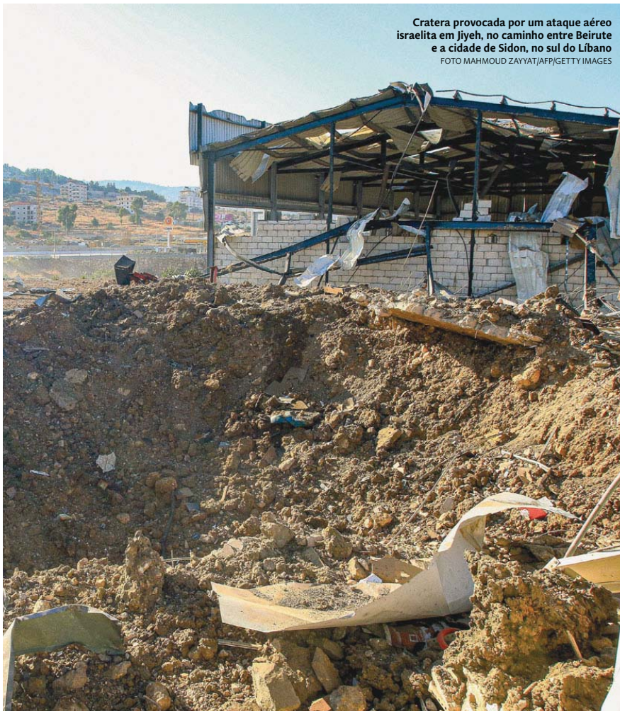
Cratera provocada por um ataque aéreo israelita em Jijeh, no caminho entre Beirute e a cidade de Sidon, no sul do Líbano