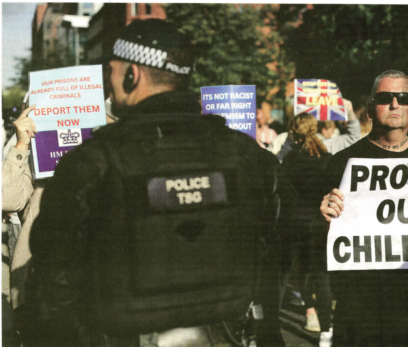
No Reino Unido, os protestos anti-imigração, impulsionados pela extrema-direita, tornaram-se violentos. Em Rotherham, vários requerentes de asilo foram agredidos.