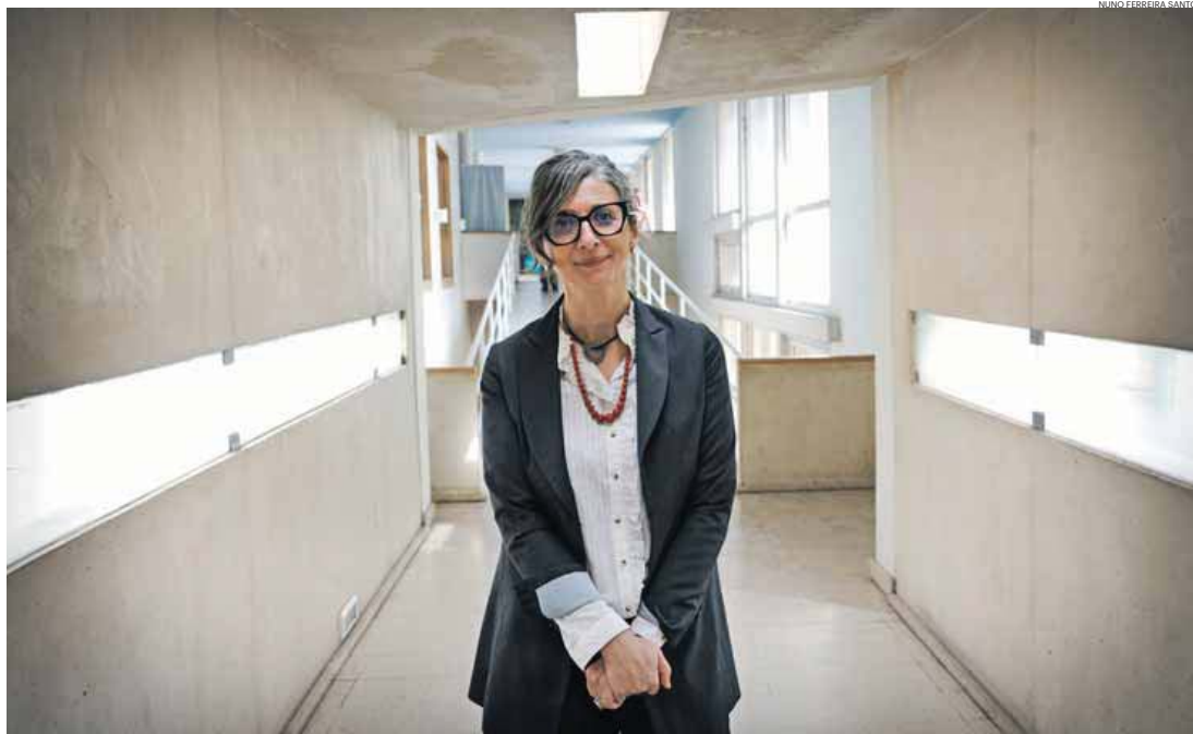
A relatora especial das Nações Unidas para os Direitos Humanos nos Territórios Palestínios Ocupados está em Lisboa

E há ainda as palavras de alguns dirigentes. “Nem sequer é uma questão de não mostrarem intenção directa”, diz ao PÚBLICO. “Há uma intenção directa: Amaleque?”, diz meio a perguntar meio a exclamar, citando a passagem da Bíblia em que Deus manda o rei Saul matar todas as pessoas em Amaleque, a nação rival do antigo Israel, ordenando-lhe que não poupe ninguém, e que foi evocado pelo primeiro-ministro, Benjamin Netanyahu (“lembram-se de Amaleque?”): “Vai e destrói tudo, todos, a mãe, o bebé, o camelo, os burros...”, cita. “É a destruição das pessoas e do seu modo de sustento. É uma ordem para muitos israelitas que se transformaram em carrascos voluntários.”