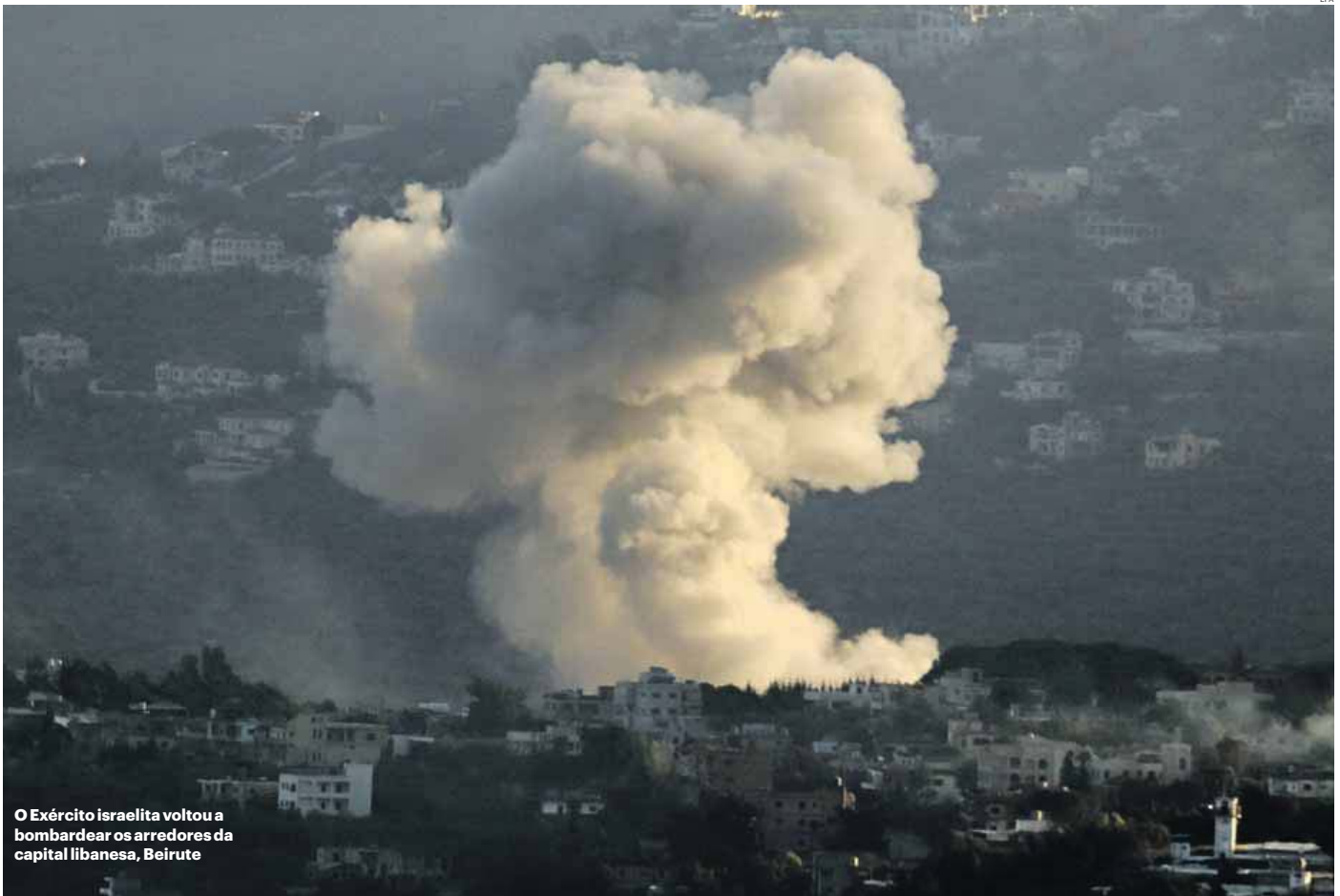
O Exército israelita voltou a bombardear os arredores da capital libanesa, Beirute