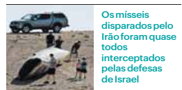
Os mísseis disparados pelo Irão foram quase todos interceptados pelas defesas de Israel

O nome deste míssil hipersónico, capaz de sair da atmosfera e regressar, fala por si. “Fattah” é um dos 99 nomes utilizados pelo Islão em referência a Alá e significa “Aquele que Abre”, “Aquele que Libertar”, “O Revelador” e “Aquele que Garante Sucesso”, de acordo com o My Islam, um site de literatura religiosa. Está operacional desde Junho do ano passado e tem uma vantagem em relação à primeira versão da arma: é altamente manobrável em missões de longo curso. O Fattah-2 está equipado com um motor de combustível sólido para controlar a direcção e hidrazina para acelerar ou realizar manobras em pleno voo – incluindo fintar o sistema de defesa israelita.