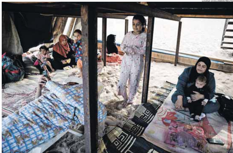
Muitos refugiados sírios fugiram do Sul do Líbano para localidades mais a norte