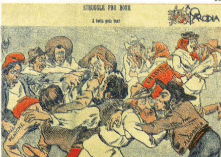
Esta caricatura de Bordallo Pinheiro publicada no jornal A Paródia, a 17 de abril de 1901, mostra a rivalidade entre localidades como Caldas da Rainha, Peniche, Alcobaca e Lisboa para o acolhimento dos refugiados bóeres, que chegaram de África em 1901, para fugir da guerra Anglo-Bóere.

territoriais na sequência da descoberta de diamantes e ouro. De acordo com a imprensa da altura, estes refugiados – descendentes de colonos europeus neerlandeses, alemães e franceses – suscitaram muita curiosidade na população portuguesa pela sua aparência. Longas barbas, polainas até ao joelho e chapéus de feltro mole com aba levantada de um lado, eram traços fora do vulgar que aparecem retratados numa caricatura de Bordallo Pinheiro no jornal A Paródia, a 17 de abril de 1901, onde mostra a rivalidade entre localidades como Caldas da Rainha, Peniche, Alcobaca e Lisboa para o acolhimento destas pessoas.