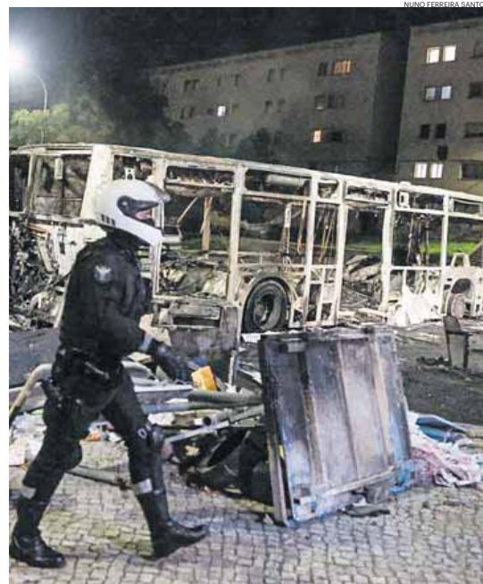
O Bairro do Zambujal esta semana

A PSP sublinhou que se empenhou “em conciliar as duas manifestações, harmonizando as intenções e desígnios de ambos os promotores, adaptando o seu dispositivo para dar resposta positiva ao exercício do direito de manifestação por parte dos cidadãos que queiram integrar as ações de manifestação, assegu-