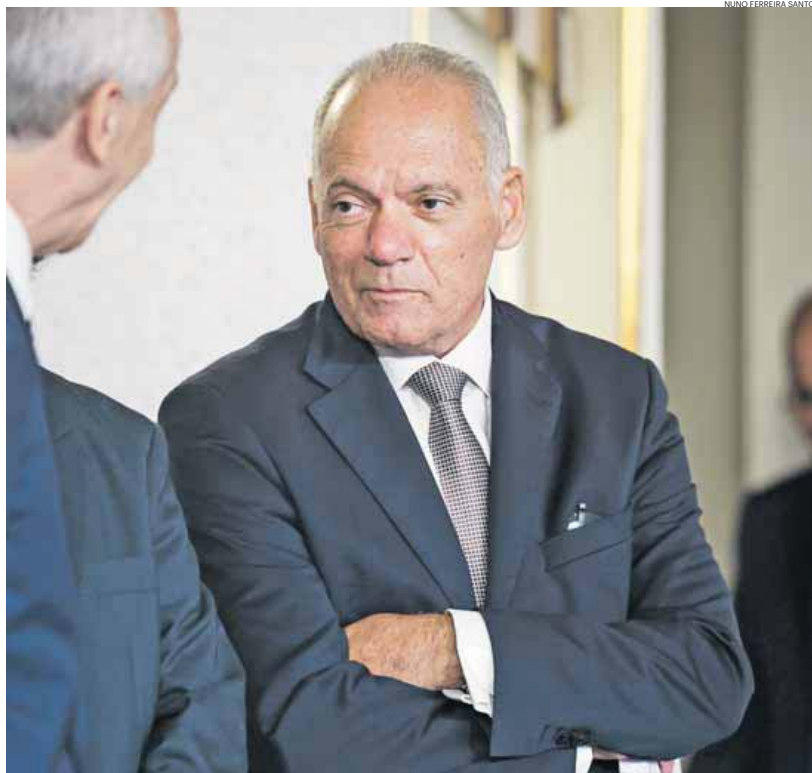
O procurador-geral da República, Amadeu Guerra, não esperou por uma queixa contra o Chega