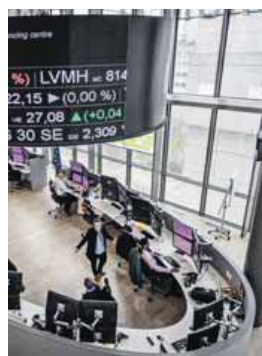
Situação em França também está a ter repercussões nos mercados

Sendo assim, o que se adivinha é um impasse político e orçamental que poderá, para além de adiar uma correcção das contas, abrir o caminho para um conflito com Bruxelas, que está a exigir à França um esforço