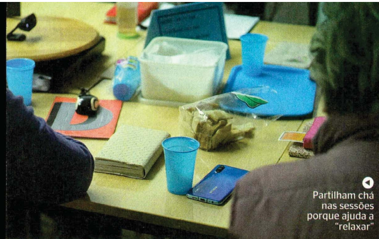
Partilham chá nas sessões porque ajuda a "relaxar"