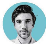
1 ANDRÉ TEODÓSIO Ator, escritor e encenador

A emoção do ressentimento, uma certa ideia de frustração e de deceção com as respostas que o sistema capitalista democrático entregou a grande parte das populações, catapultou uma crescente exigência de dignidade. Sendo um combustível poderoso, com impactos profundos na nossa sociedade e na nossa vida pública, estava aqui encontrado um filão aproveitado por muitos, que procuraram ser os porta-vozes deste descontentamento. No programa Anatomia do Ressentimento , emitido na Antena 1 e disponível nas plataformas de podcast habituais, procurou-se “dissecar” esta emoção que perpassa pelas sociedades, e tentar perceber melhor as suas causas e os efeitos psicológicos, sociais e políticos. No final de cada episódio, os 26 convidados – com formações, experiências e ocupações muito distintas – deixaram ideias singelas para combater o ressentimento. Aqui estão elas.