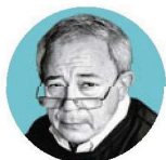
12 JAIME NOGUEIRA PINTO Político e historiador

“O nosso cérebro está programado para identificar injustiça, para identificar diferenças, porque o meu grupo vai estar prejudicado versus outros. Portanto, há vieses cognitivos que geram emoções de ressentimento, entre outras. Portanto, se eu pudesse tomar uma medida, seria melhorar a literacia emocional e, sobretudo, dar estratégias de gestão emocional, gestão de conflitos, gestão daquilo que o nosso cérebro produz e que toma conta de nós, que são as emoções. A maior parte das pessoas não percebe que as emoções estão a tomar conta delas e não percebe que os vieses com que analisam a realidade vão influenciar grandemente o seu comportamento, mas que, olhadas de fora, aparentemente há ali algumas incongruências na narrativa, por exemplo. Era muito importante educar as crianças, os jovens e os adultos com estratégias de gestão emocional, identificação de vieses cognitivos, de vieses na perceção das injustiças, porque isso, certamente, mesmo que o mundo fosse imperfeito, iria mitigar a sensação de ressentimento e as suas consequências.”