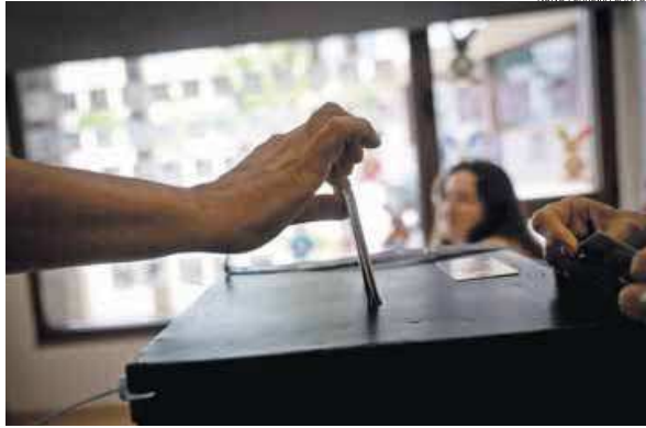
Portalegre foi, pela 4.ª vez, o círculo com mais votos desperdiçados

O fenómeno não é isolado. Em termos absolutos, é o BE, sistematicamente, o partido que mais votos vê perdidos. Aconteceu nas três últimas