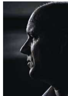
Paulo Raimundo, secretário-geral do PCP

Acresce que, para Raimundo, “as eleições não alteraram nada” sobre o caso da empresa familiar do primeiro-ministro, que “devia ter-se demitido”: “As eleições não o livram dessa profunda incompatibilidade e das responsabilidades enquanto primeiro-ministro”, vincou.