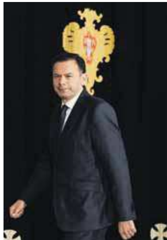
Luís Montenegro obteve 32% nas eleições legislativas

O estudo analisou também os temas mais vezes colados aos partidos e aos líderes partidários. Do lado da AD, o caso Spinumviva, empresa fundada por Luís Montenegro e depois cedida aos seus filhos, dominou as menções ao primeiro-ministro (57% das referências ao chefe do executi-