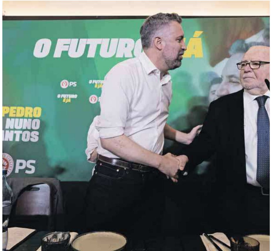
Manuel Alegre apareceu na campanha eleitoral do PS para dar apoio a Pedro Nuno Santos

Alegre diz que “o PS tem de ser capaz de ultrapassar esta fase”, porque “não pode voltar a perder uma eleição com o Chega”. E não acha que os problemas do PS se resolvam com meras substituições de líder: “Se vamos substituir um líder por outro sem fazer uma reflexão e cor-