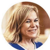
Elza Pais Deputada do PS

Mandatos Em 2019, com a segunda alteração à Lei da Paridade, 86 mulheres foram eleitas deputadas, o que corresponde a 38,7% de todo o hemiciclo. Nunca mais se repetiu.