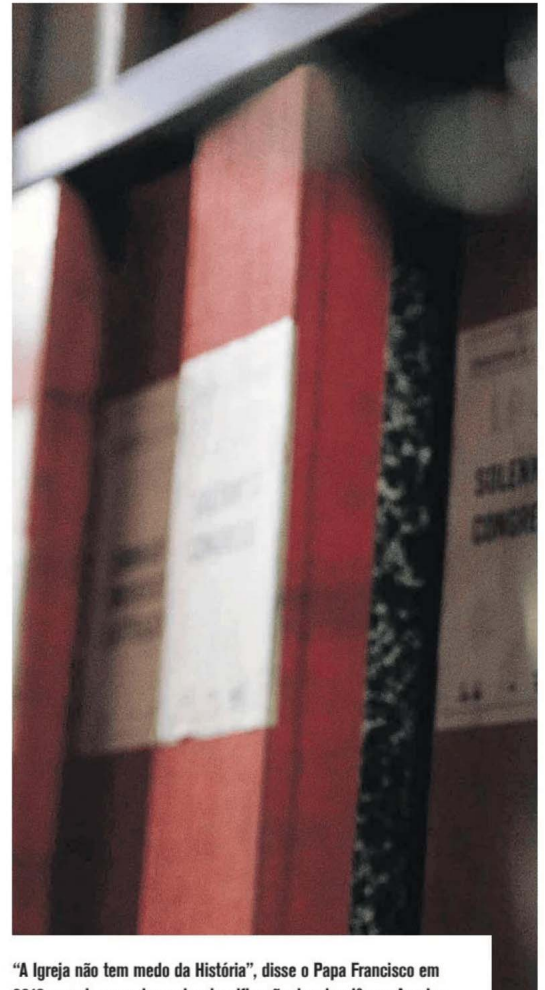
“A Igreja não tem medo da História”, disse o Papa Francisco em 2019 quando anunciou a desclassificação dos dossiês no Arquivo Secreto do Vaticano (hoje Arquivo Apostólico do Vaticano) referentes ao pontificado do Papa Pio XII, entre 1939 e 1958. O líder da Igreja Católica no tempo da II Guerra Mundial foi acusado de não ter levantado a voz contra o fascismo e o nazismo.

No caso das FP-25, sendo um período mais recente, ainda há pessoas vivas que estiveram envolvidas e vítimas, assim como as suas famílias. Mas a questão é que “o processo decorreu em democracia, com informação”. De facto, “todos eles já apareceram nos jornais, foi tudo publicado, o julgamento decorreu e de-