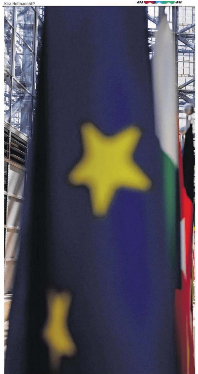
A Comissão Europeia propôs em fevereiro mudanças com o objetivo de reduzir