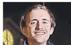
Pedro Neto Monteiro Presidente da FAL

“Cerca de 70% a 80% dos estudantes não têm alojamento e têm de se virar para o mercado privado e mercado paralelo que existe, com condições que não são dignas”