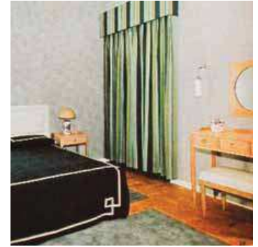
“Casas da Eva”: exteriores de 1933, 1955, 1962, 1965 e 1966. Interiores: cozinha de 1957; sala de 1965; e quarto de 1968