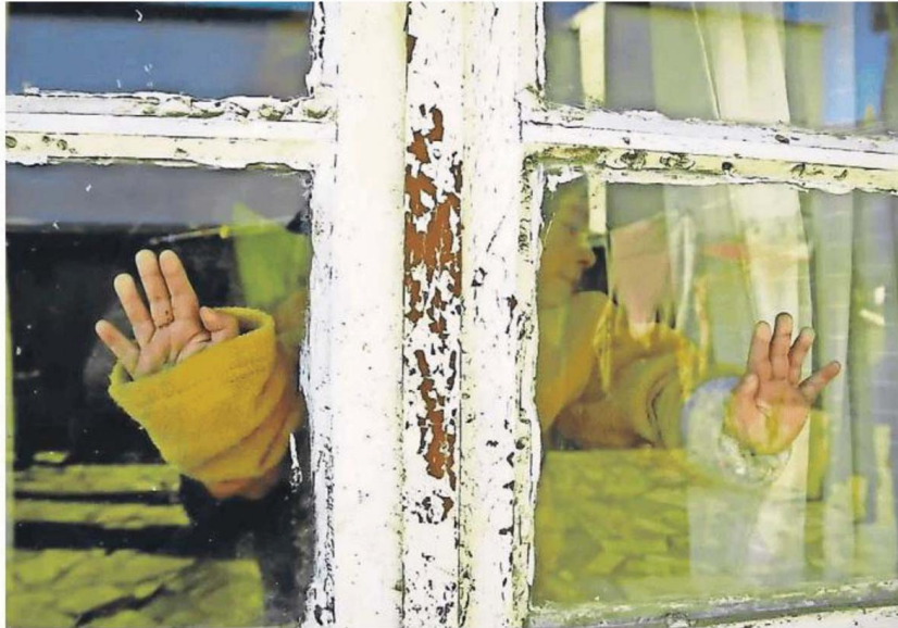
Investigadores defendem a criação de indicadores locais de pobreza

Investigadores do ISCTE alertam que municípios têm meios distintos para gerir Ação Social