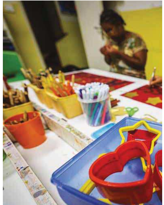
Alunos para quem foram mobilizadas medidas selectivas e/ou adicionais de suporte à aprendizagem e à inclusão

Olhemos para estes alunos: em 2024/25, havia nas escolas 98.200 alunos com relatórios técnico-pedagógicos (RTP), que fundamentam a necessidade de medidas de suporte à aprendizagem e à inclusão. A grande maioria (77.149) beneficiava das chamadas medidas selectivas – as mais generalizadas –, nas quais se incluem o reforço das aprendizagens, o apoio psicopedagógico, as adaptações curriculares ou o apoio tutorial. Os dados são da Direcção-Geral de Estatísticas da Educação e Ciência (DGEEC) e revelam que havia ainda 2456 estudantes a usufruir de medidas adicionais, dirigidas a alu-